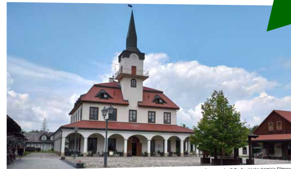
Miasteczko Galicyjskie – Rynek, fot. Ilona Dusza Rzeszowska © Podkarpacka Komisja Filmowa

W ostatnim czasie coraz większą popularność wśród filmowców zyskuje graniczące z Sądeckim Parkiem Etnograficznym - Miasteczko Galicyjskie w Nowym Sączu. To sąsiedztwo zwiększa produkcjom filmowym możliwości korzystania z planów o miejskim i wiejskim charakterze. Jest to obiekt w całości rekonstruowany, który oddaje w doskonały sposób klimat karpackiej prowincji. Miasteczko Galicyjskie można było zobaczyć m.in. w filmie „Papusza” (2013) w reż. K. Karauze i J. Kos-Krauze. Film ten jako pierwszy na świecie został nakręcony w języku romskim.