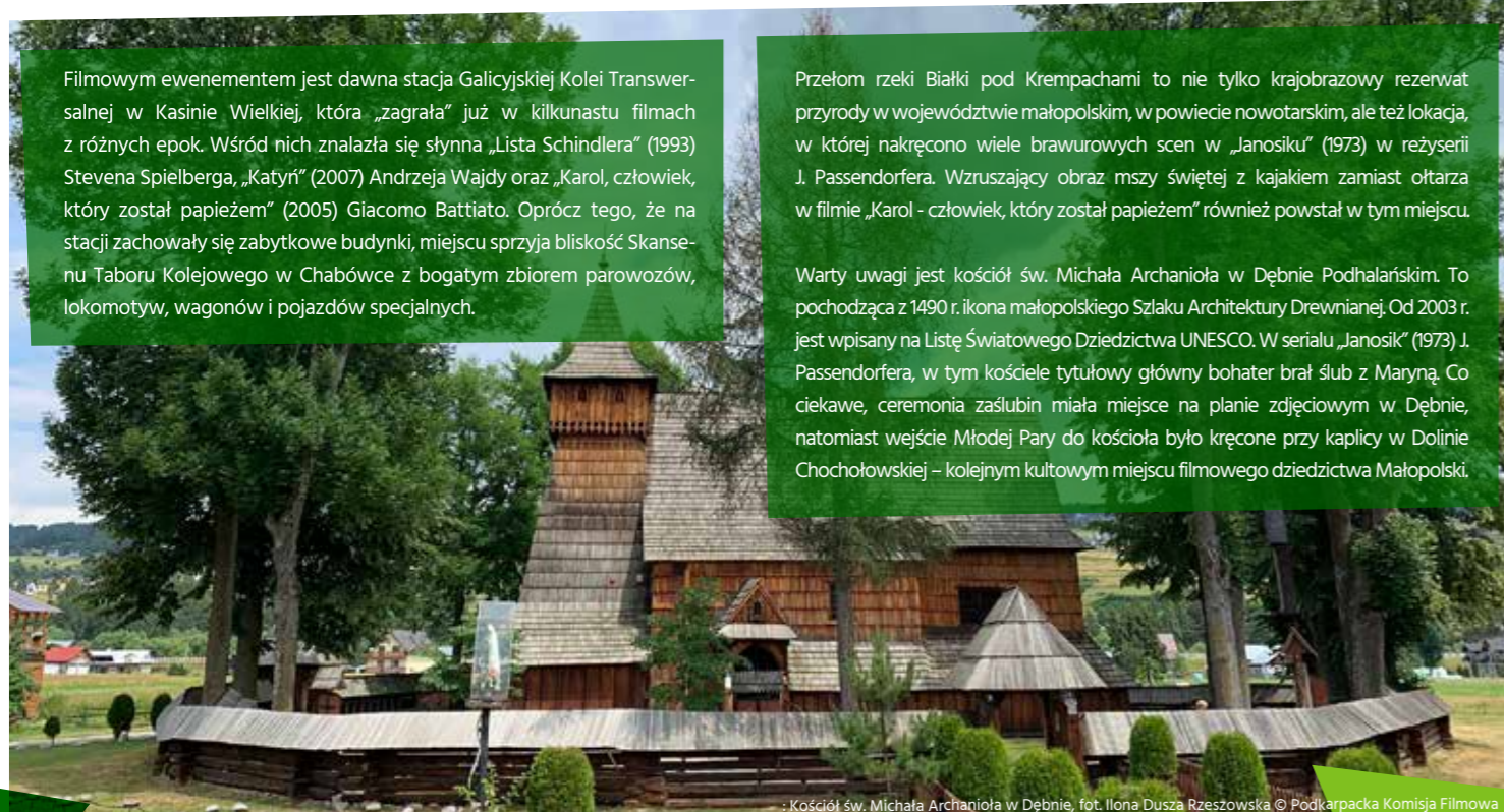
Kościół św. Michała Archanioła w Dębnie

Warty uwagi jest kościół św. Michała Archanioła w Dębnie Podhalańskim. To pochodząca z 1490 r. ikona małopolskiego Szlaku Architektury Drewnianej. Od 2003 r. jest wpisana na Listę Światowego Dziedzictwa UNESCO. W serialu „Janosik” (1973) J. Passendorfera, w tym kościele tytułowy główny bohater brał ślub z Maryną. Co ciekawe, ceremonia zaślubin miała miejsce na planie zdjęciowym w Dębnie, natomiast wejście Młodej Pary do kościoła było kręcone przy kaplicy w Dolinie Chochołowskiej – kolejnym kultowym miejscu filmowego dziedzictwa Małopolski.