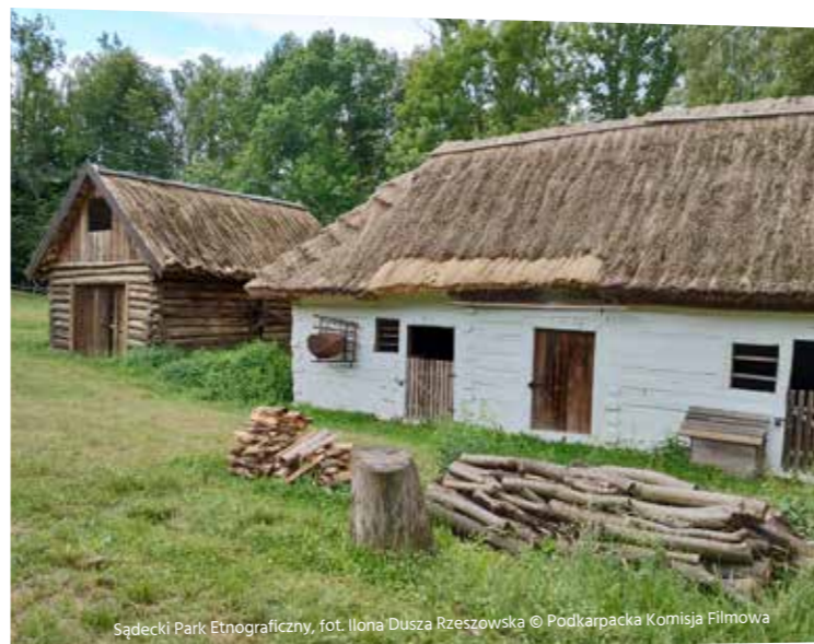
Sądecki Park Etnograficzny

Scena w filmie „Janosik. Prawdziwa historia” (2009) Agnieszki Holland i Kasi Adamik, gdy ranny Juraj Janosik leży na skibach świeżo zaoranej ziemi, rozgrywa się na jednym z poletek Sądeckiego Parku Etnograficznego w Nowym Sączu. Scena z Horpyną wróżącą Bohunowi przy ogromnym młyńskim kole w filmie „Ogniem i mieczem” (1999) w reż. Jerzego Hoffmana miała miejsce przy młynie wodnym w skansenie Muzeum – Orawski Park Etnograficzny w Zubrzyca Górnjej. Z kolei Nadwiślański Park Etnograficzny we wsi Wygiełzów stał się sceną filmowej ucieczki ludności cywilnej na wschód po inwazji Niemiec na Polskę w filmie „Karol – człowiek, który został papieżem” (2005) w reż. Giacomo Battiato.